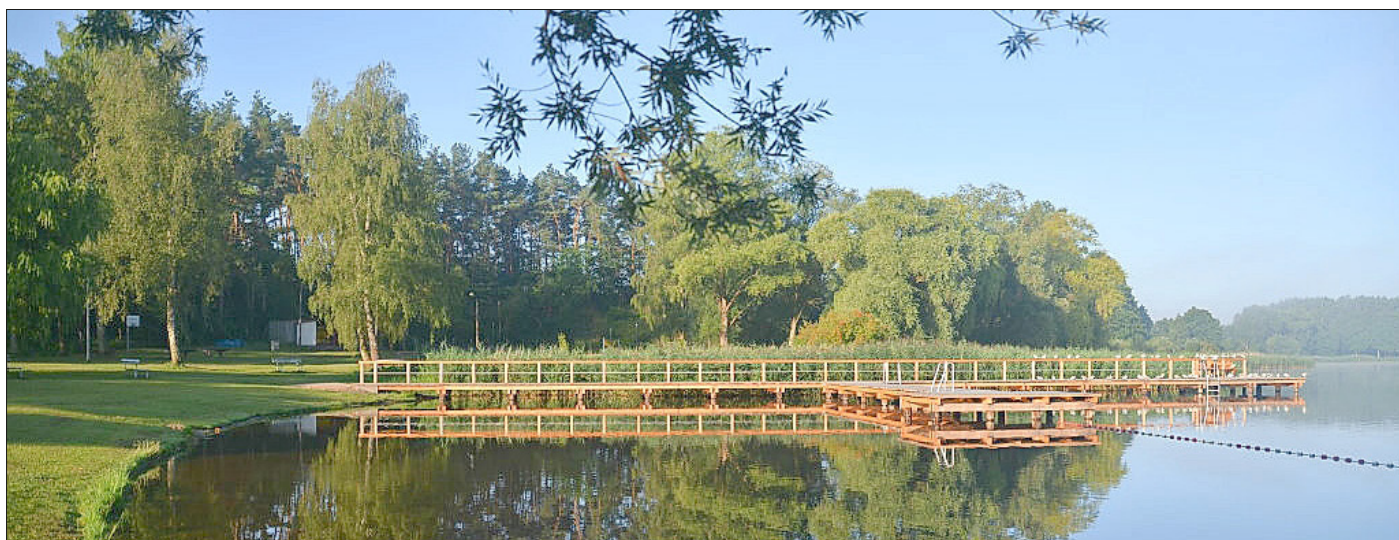
An der Badestelle Barnin