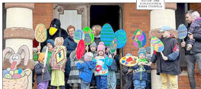
Kinder der Ostermalerei 2023

Liebe Kinder aus Raben Steinfeld, mit viel Begeisterung habt ihr letztes Jahr an unserer bunten Ostereiermalaktion im Schloss mit euren Eltern oder Großeltern teilgenommen. Das wollen wir mit euch wiederholen, um auch dieses Jahr unser Dorf und unser Schloss bunt zu schmücken. Farben und Pinsel stehen natürlich wieder für euch in einer bunten Vielfalt bereit. Wir freuen uns auf euch und eure tollen neuen Ideen in diesem Jahr.